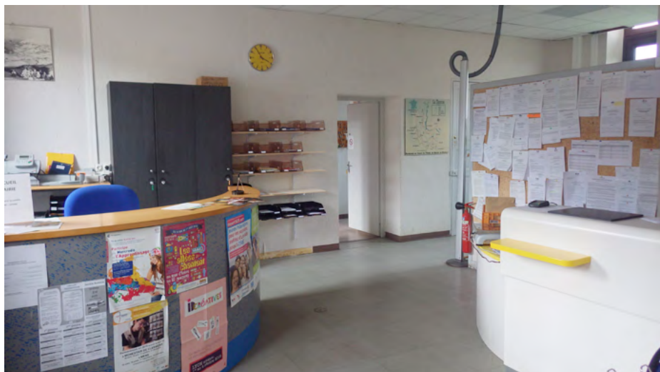
↑ Accueils Mairie et Agence postale

Les accueils de la mairie et de l'agence postale communale ont été retravaillés, pour permettre d'accroître l'espace entre les deux accueils et de garantir une meilleure confidentialité des échanges.