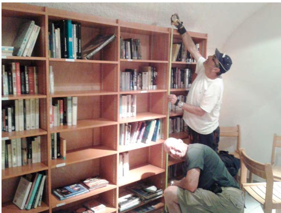
← Nouveau bureau du Maire

Au sein de la mairie, deux nouveaux bureaux ont été entièrement construits, afin de permettre au personnel et aux élus de travailler dans de meilleures conditions avec de plus grands espaces de travail.