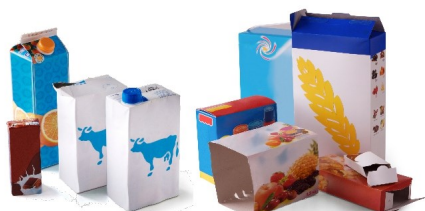
Tous les cartons et briques alimentaires