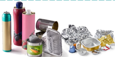
Tous les emballages métalliques