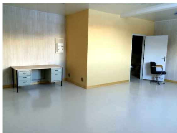
1er étage de la piscine