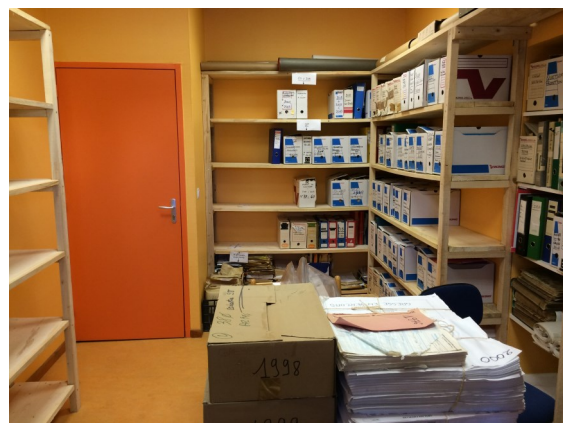
Local des archives,