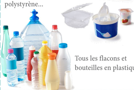
Tous les flacons et bouteilles en plastique