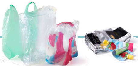
Tous les emballages en plastique : pots, sacs et films souples, barquettes plastiques ou polystyrène...