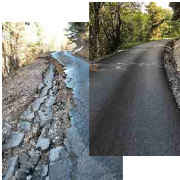
Route du Serpaton, avant et après les travaux