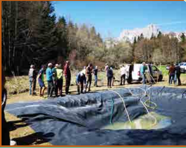
L'équipe du chantier de création de la mare de l'Odysée Verte