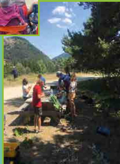
Les animations de l'été par GEVA